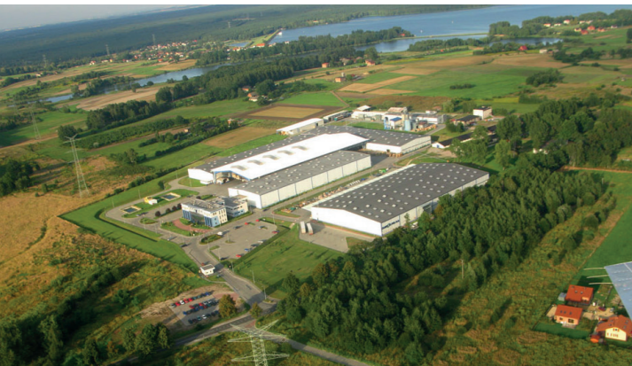
Classen Rybnik-Zwonowice z lotu ptaka.