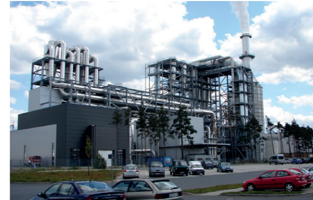
Classen – fabryka w Niemczech

Lignum Klaster Technologii Drewna - jest organizacją zrzeszającą spółki współpracujące w ramach produkcji, sprzedaży i projektowania produktów marki Classen. Lignum jest jednocześnie spółką koordynującą działania tych spółek w celu zapewnienia dynamicznego rozwoju na konkurencyjnym rynku poprzez stworzenie optymalnych warunków prowadzenia działalności, wspieranie innowacyjności, wspólne prowadzenie projektów badawczo-rozwojowych, podnoszenie kwalifikacji pracowników, promocję i doradztwo finansowo-organizacyjne. Istotnym elementem działań Lignum jest współpraca z jednostkami naukowo-badawczym oraz uczelniami wyższymi, wśród których Wydział Technologii Drewna Szkoły Głównej Gospodarstwa Wiejskiego jest kluczowym partnerem, zwłaszcza w zakresie rozwiązywania problemów technologicznych, prac badawczych i realizacji programów stażowych.